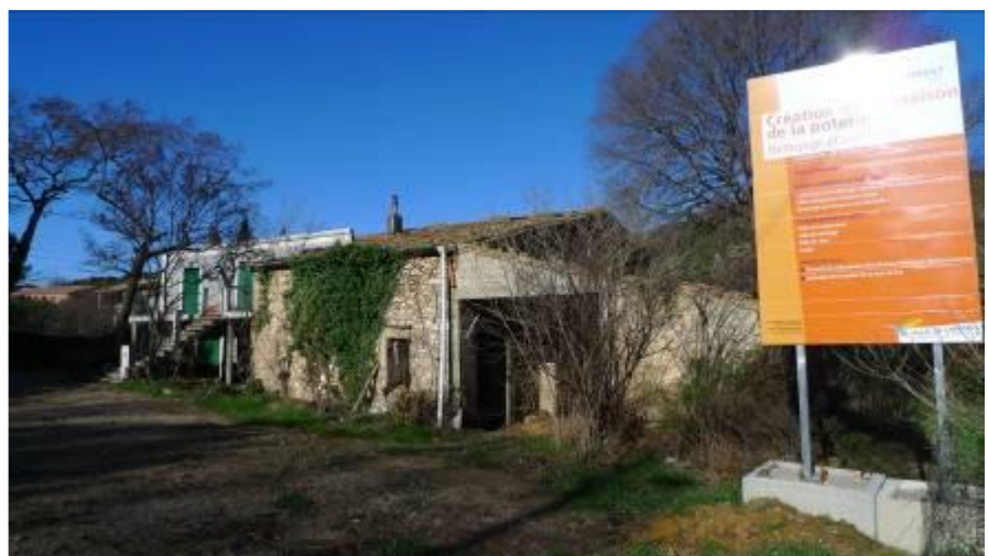
L'atelier et l'appartement