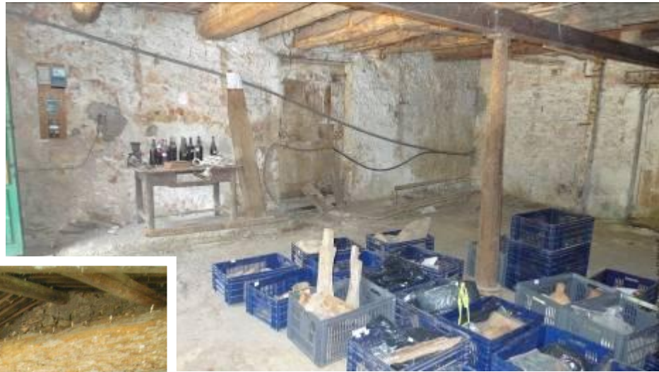
Nettoyage archéologique Été 2009