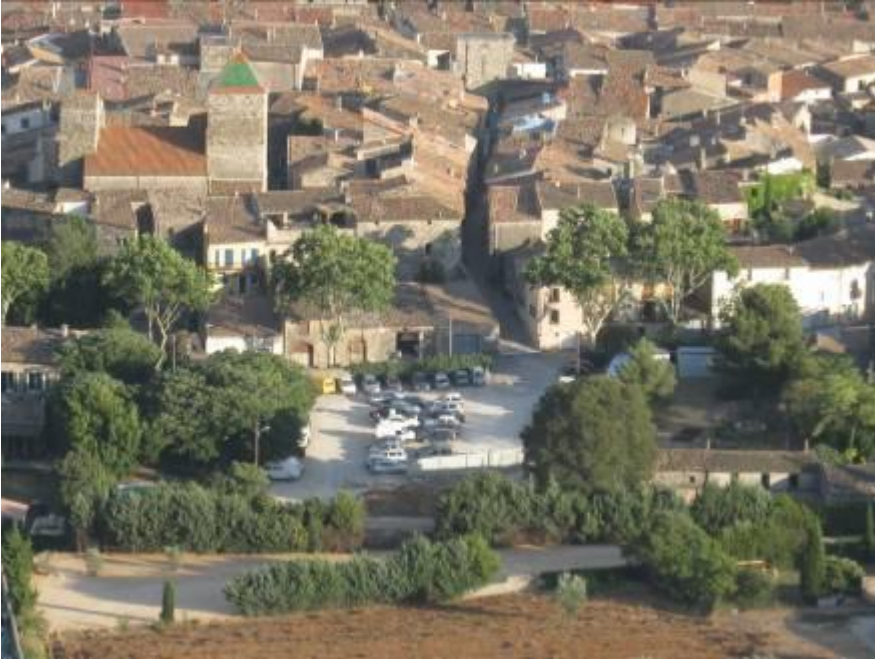
Le parc de stationnement