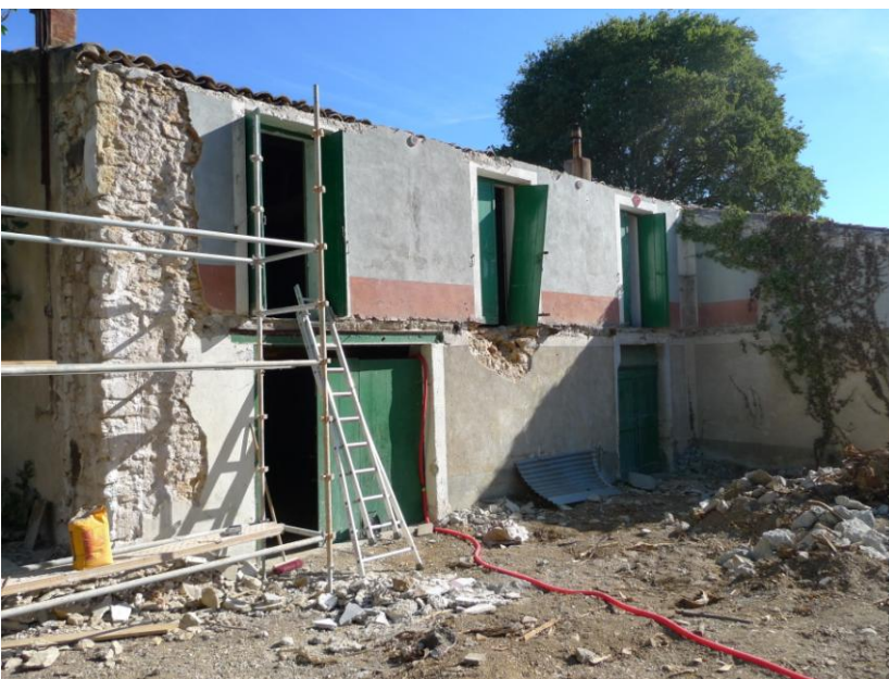
Piquetage des murs en vue de la réfection des enduits