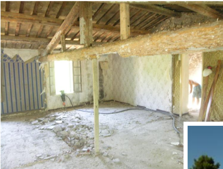
Démolition intérieure de l'appartement Juillet 2010