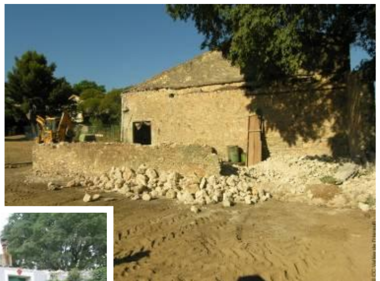
Démolition de l'annexe est de l'atelier Juillet 2010